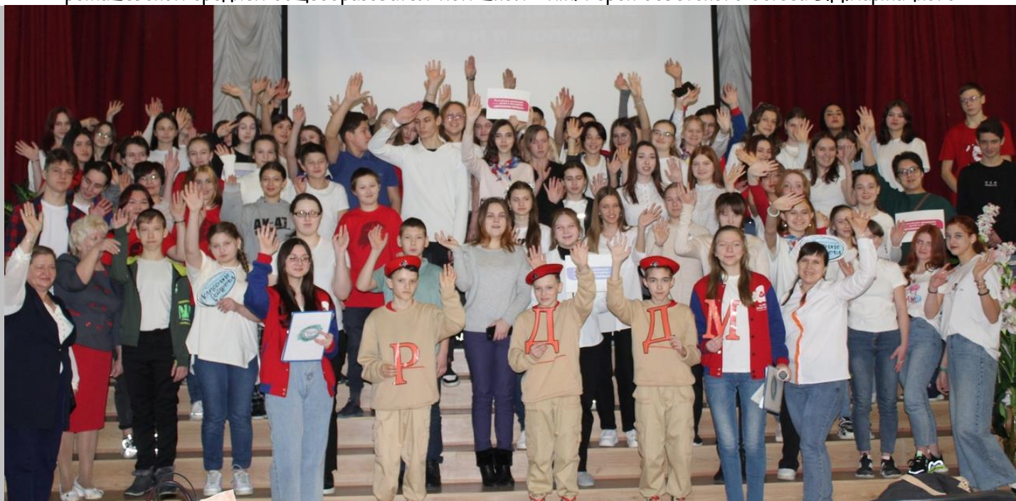
материал подготовила Дарья Крапатухина