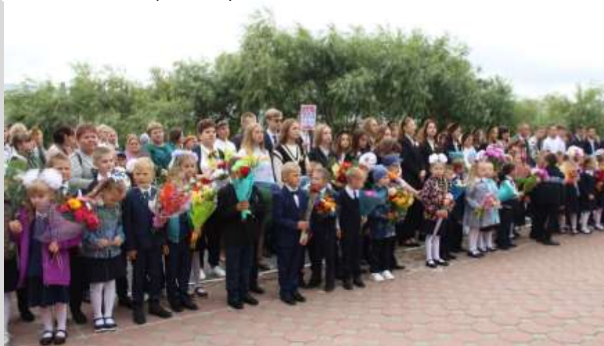
1 сентября 2022 года в МАОУ «Аромашевская СОШ им. В. Д. Кармацкого»

будет звучать государственный гимн. Детворе предстоит не просто слушать, но и подпевать, поэтому, кто еще не знает слова, нужно выучить!