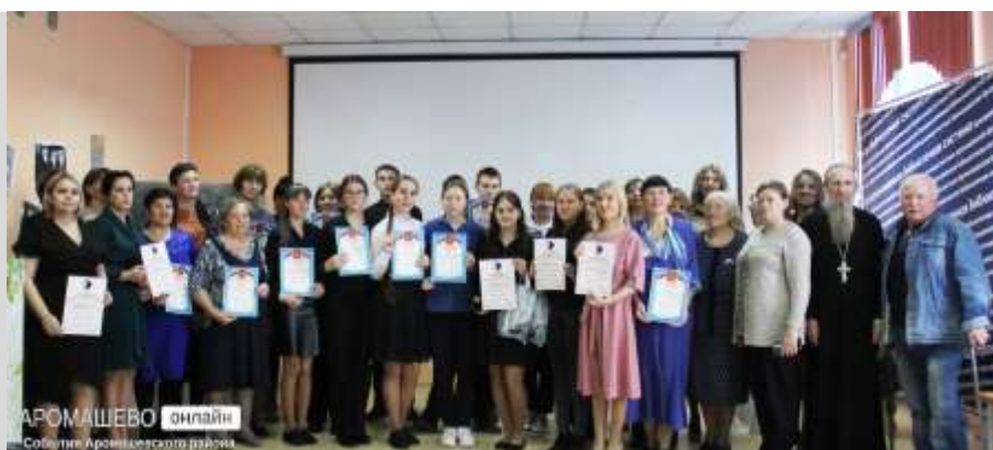
Участники конкурса и жюри

Такие поэтические встречи надолго остаются в памяти и дают возможность еще раз прикоснуться к творчеству нашего знаменитого земляка.