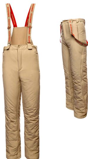
Брюки утеплённые (тактические) бежевого цвета