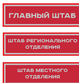
Нарукавный знак, устанавливающий принадлежность к структуре органов ВВПОД «ЮНАРМИЯ»