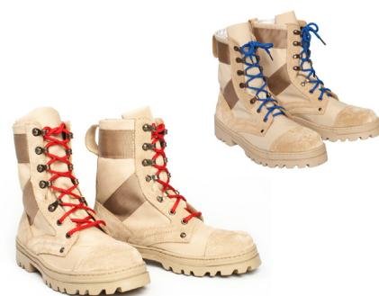
Ботинки с высокими берцами утеплённые бежевого цвета со шнурками красного (синего, бежевого) цвета