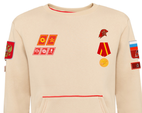
Размещение знаков различия, знаков отличия и иных геральдических знаков на толстовке бежевого цвета