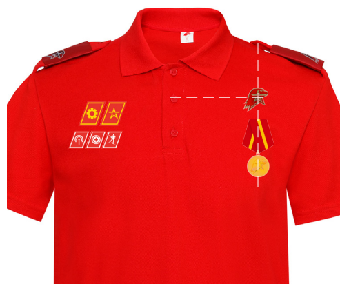
Размещение знаков различия, знаков отличия и иных геральдических знаков на рубашке поло красного (синего) цвета