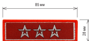
Нарукавный знак, определяющий принадлежность к ВВПОД «ЮНАРМИЯ»