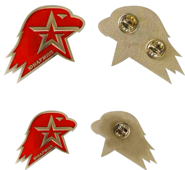
Большая (кокарда) и малая (значок) эмблема ВВПОД «ЮНАРМИЯ»