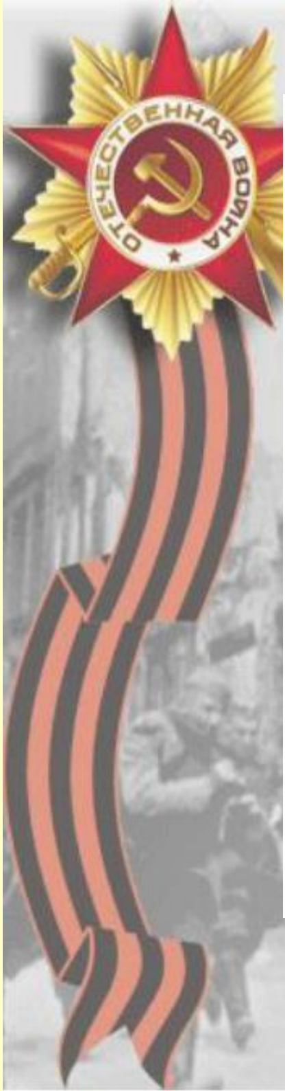
Наступление Южного фронта. 17 июля - 2 августа 1943 г.