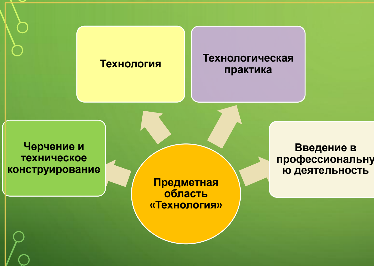
Распределение часов по классам