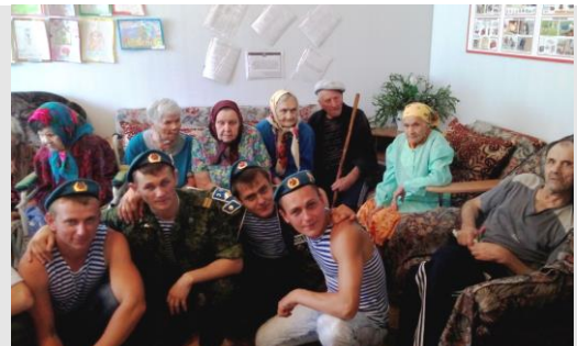
«Воинское братство» с милосердием в «Милосердии» (День ВДВ)

Е. К.: Легко ли вам находить общий язык с пожилыми людьми?