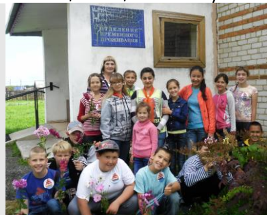
Воспитанники летнего лагеря «ТАРус» в «Милосердии»

Н. Г.: Единственной трудностью чаще всего является человеческий фактор, потому что люди пожилого возраста, как дети, капризные. Они нуждаются во внимании, заботе. Один хочет, чтобы с ним ласково общались, с другим, наоборот, надо поостороже, даже иногда нужно прикрикнуть. Начинаешь общаться с одним, другой начинает ревновать, хочет, чтобы ему больше внимания уделили.