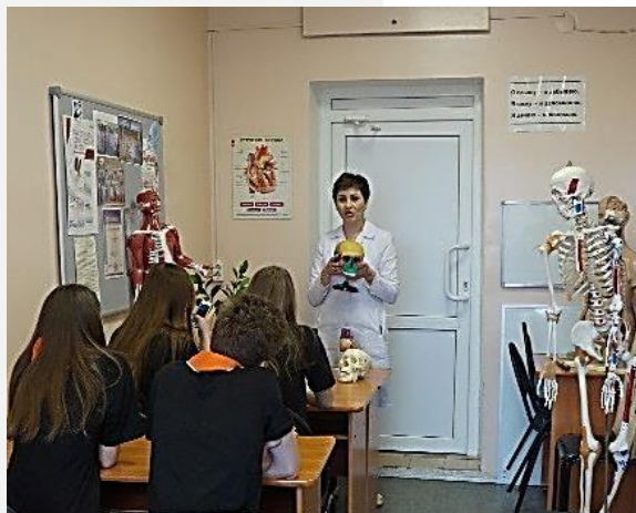
Кабинет анатомии ТМК