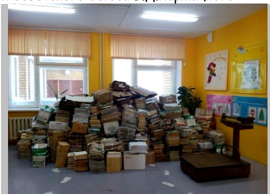
«Урожай» макулатуры

Аромашевская – 2504 кг, Кармацкая – 100 кг, Кротовская – 151 кг, Малиновская – 200 кг, Новоаптулинская – 210 кг, Новоберезовская – 50 кг, Новопетровская – 700 кг, Русаковская – 160 кг, Слободчиковская – 220 кг, Юрминская – 100 кг.