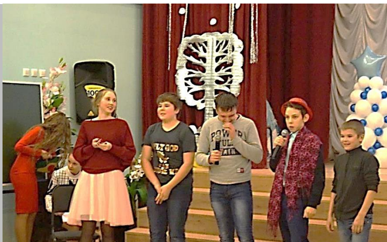
Фрагменты Новогоднего представления