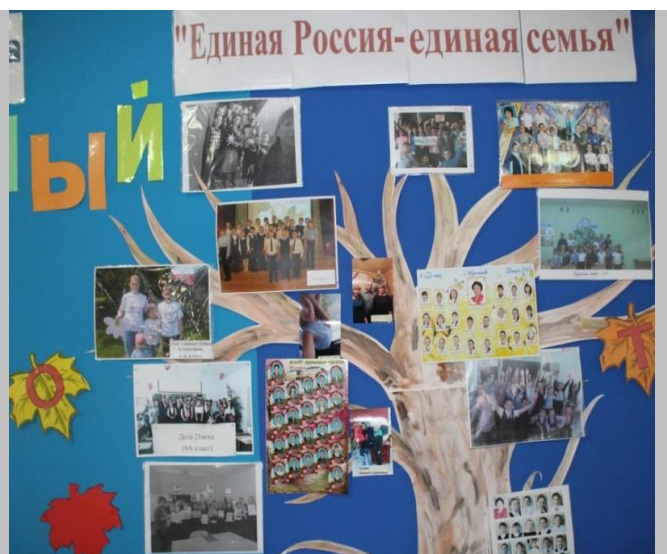
Фото с мероприятия