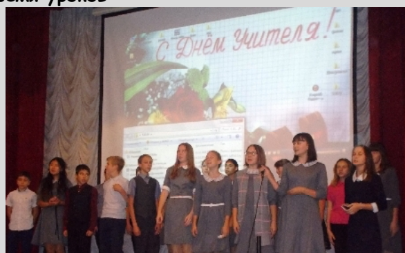
Фрагменты праздничного концерта для учителей нашей школы