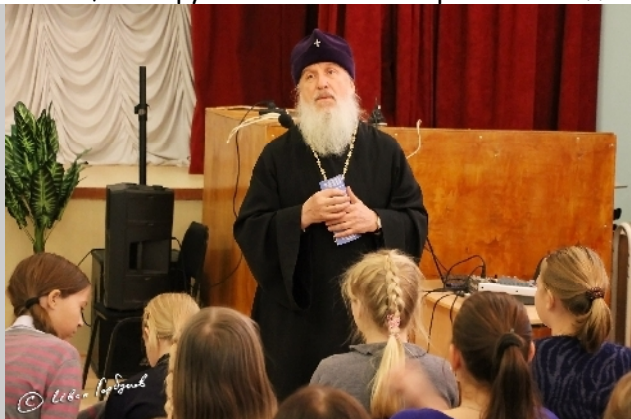
Фрагмент беседы с учащимися школы

Отец Димитрий является Ректором Тобольской духовной семинарии. С ним приезжали его ученики - учащиеся Тобольской православной гимназии из 6,7,8,9,10 классов. Они исполняли церковное песнопение на греческом и русском языках. На конкурсе православных гимназий они стали одними из лучших, им предоставили возможность выступить в Москве.