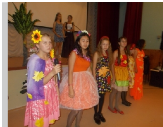
Участницы конкурса «Мисс Осень»

Организатором был 8 «а» класс, который подготовил концертно-развлекательную программу. Также все присутствующие во главе с жюри выбирали «Мисс Осень». Оценивалось представление участницы, ее костюм и кулинарное изделие.