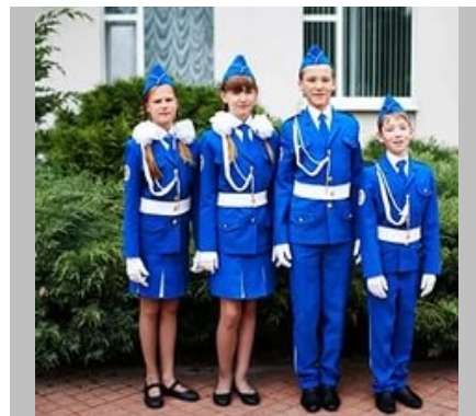
Норвегия - 2014