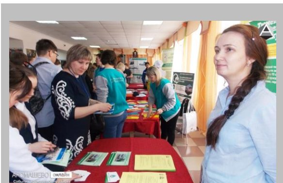
«Торговые» места ярмарки