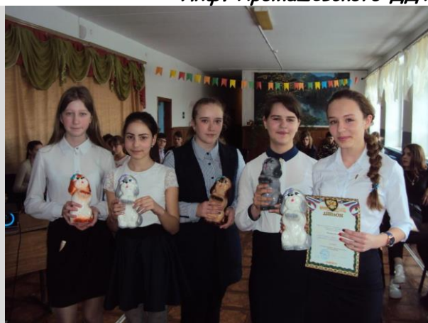
Фото с мероприятия