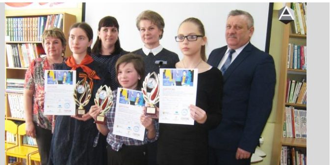
Победители районного этапа с членами жюри

Аромашевские школьники стали призерами областного фестиваля ГТО, который проходил с 25 по 27 марта в Тюмени.