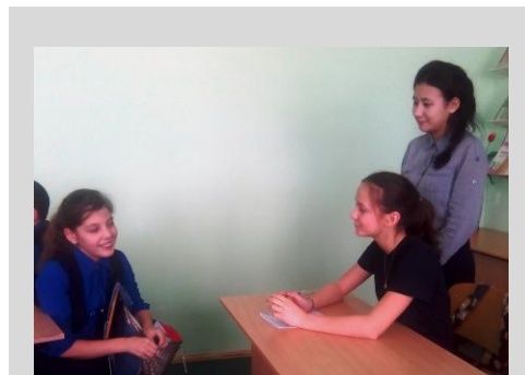
Интервью с победительницей

Победительница и призеры согласились дать небольшое интервью. Пятиклассники сказали, что, независимо от места на пьедестале, такие конкурсы им очень интересны, и они хотели бы чаще в них участвовать.