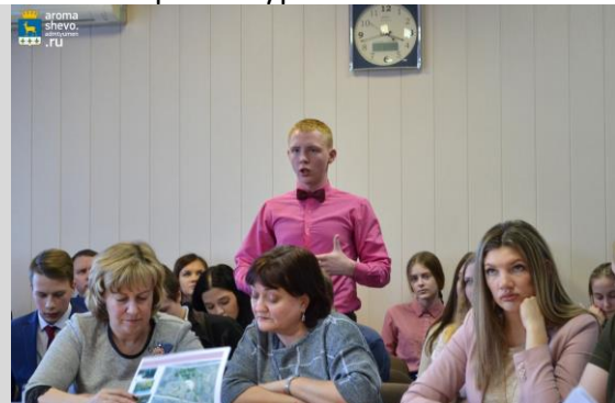
Активные участники обсуждения проекта: наши педагоги и старшеклассники