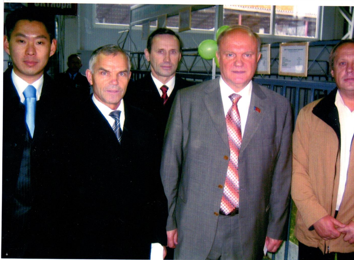
Встреча с Ю.Лужковым