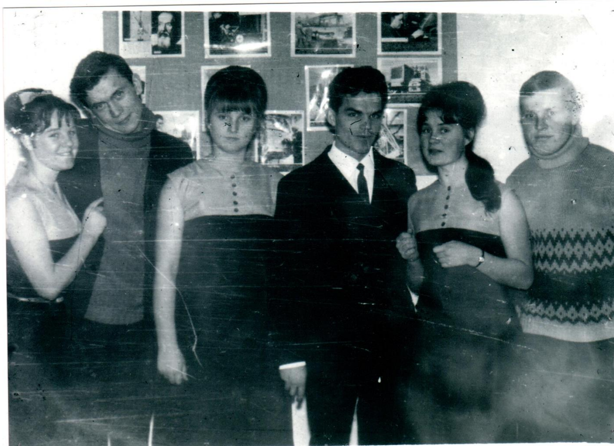
1961 год, коллектив доярок в Березово.