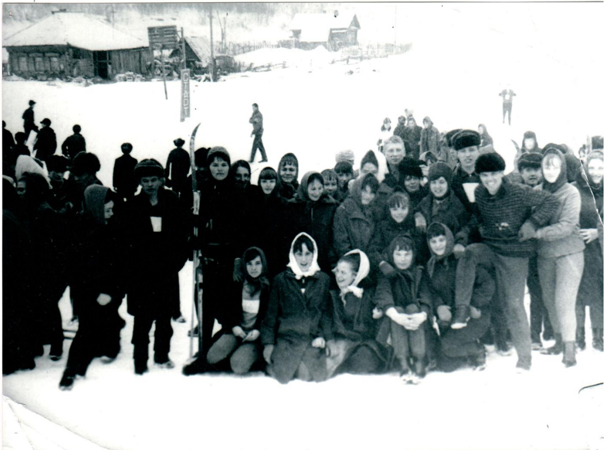
1967 год, Тобольск «День здоровья»